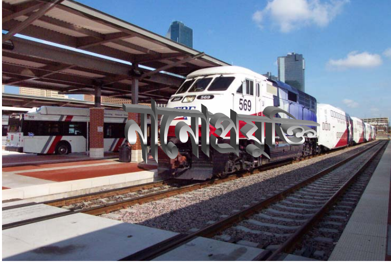
সামনে আসছে সম্ভাবনাময় নানোপ্রযুক্তির ট্রেন। আমরা কি এই ট্রেনটাও ধরবনা?

সহজ ভাষায় বলতে গেলে নানো হল মাপের একটি একক। এক মিটারের ১০০ কোটিভাগের ( 1 \times 10^9 ) এক ভাগকে এক নানোমিটার (Nanometer) বলা হয়। এই নানোমিটার স্কেলে যে সমস্ত প্রযুক্তিগুলি সম্পর্কিত সেইগুলিকে নানোপ্রযুক্তি বলে। আপনারা নিশ্চয় জানেন যে প্রতিবছরই আমাদের ইলেক্ট্রনিক্স যন্ত্রপাতির আকারে ছোট হচ্ছে। আর এই সমস্ত সবাই হচ্ছে এই নানোপ্রযুক্তির কল্যাণে। নানোপ্রযুক্তি কিন্তু একদম নতুন কোন প্রযুক্তি নয় যে একদম গোড়া থেকে শুরু করতে হবে। ফলিত পদার্থবিদ্যা, ব্যবহারিক পদার্থবিদ্যা, রসায়ন, ইলেক্ট্রিক্যাল ইঞ্জিনিয়ার, মেকানিক্যাল ইঞ্জিনিয়ার ইত্যাদি বিষয়গুলির সাথে অতপ্রোতভাবে জড়িত এবং এই সমস্ত বিষয়ের গবেষক ও ছাত্র/ছাত্রীরা নানোপ্রযুক্তি নিয়ে কাজ করতে পারে।